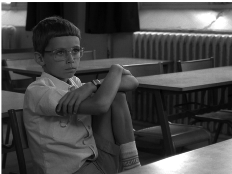
Straub & Huillet. En rachâchant , 1982. Película de 35 mm transferida a vídeo, b/n, sonido, 7'.

La forma en que las sociedades definen y distribuyen el conocimiento indica el modo en que se estructuran, el orden social dominante y los grados de inclusión y exclusión. La exposición Un saber realmente útil investiga diversas situaciones educativas heterodoxas, espontáneas, antijerárquicas, no académicas, procedimentales y centradas fundamentalmente en el potencial transformador del arte.