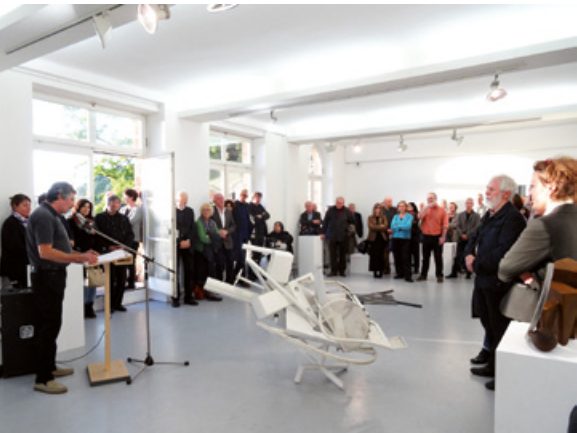
»Stahlplastik in Deutschland – gestern und heute« 2014

Mitgliedsbeitrag: € 35,- jährlich; Studierende, Schülerinnen und Schüler € 10,- / Kunststudierende frei / Firmen ab € 500,-. Für die Mitgliedschaft erhalten Sie eine Spendenbescheinigung. Für weitere Informationen stehen wir Ihnen gerne zur Verfügung.