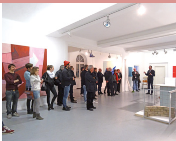
»Höhenluft #9« 2014