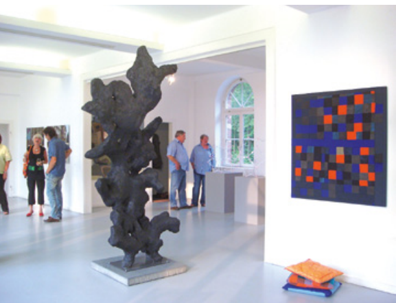
»25 + 25« 2010

Weitere Informationen finden Sie unter www.kunstverein-wilhelmshoehe.de und www.wolfganghartmannpreis.de