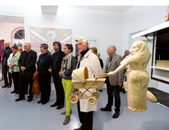
»Wolfgang Hartmann Preis« 2013

Unter dem Titel »Höhenluft« schreibt die Ateliergemeinschaft Wilhelmshöhe im Kunstverein Wilhelmshöhe Ettlingen seit 2011 einen Wettbewerb für Studierende der Karlsruher Kunsthochschulen aus. Studentinnen und Studenten der Staatlichen Akademie der Bildenden Künste Karlsruhe sowie der Hochschule für Gestaltung Karlsruhe erhalten in der Regel drei Mal im Jahr die Möglichkeit, in den Räumen des Kunstvereins Wilhelmshöhe für die Dauer von fünf Tagen eine Einzel- oder Gruppenausstellung zu realisieren. Das Anliegen der Ateliergemeinschaft Wilhelmshöhe ist die Förderung junger Künstlerinnen und Künstler, die am Anfang Ihrer Karriere stehen. Sie möchte deshalb Studierenden die Möglichkeit bieten, sich mit ihren Arbeiten auch außerhalb der jeweiligen Hochschule zu präsentieren. 2015 findet die Jubiläumsausstellung und eine weitere Höhenluft statt. Die Ausstellungstermine, Wettbewerbsunterlagen und weitere Informationen finden Sie auf unserer Homepage unter der Rubrik »Höhenluft«.